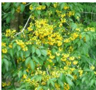
Folhas e flores