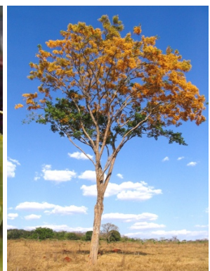
Árvore em floração

Agradecemos a sua participação nesta iniciativa!