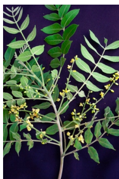
Folhas e flores